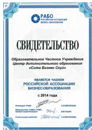
CBS является членом Российской ассоциации бизнес-образования (РАБО)