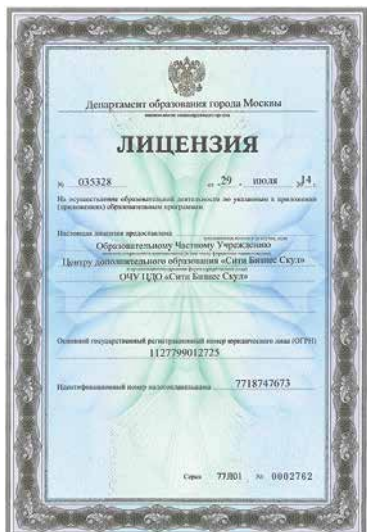
Лицензия на образовательную деятельность № 035 328