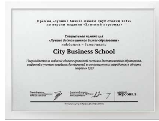
1-е место в номинации «Лучшее дистанционное бизнес-образование»