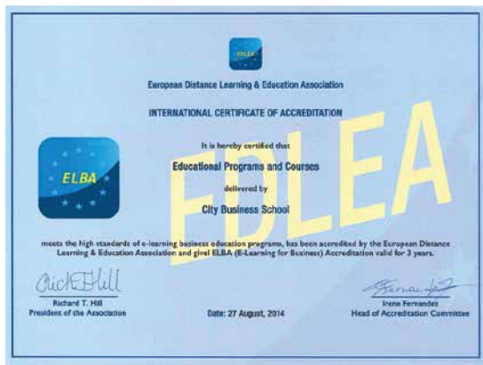
Европейская аккредитация European Distance Learning and Education Association